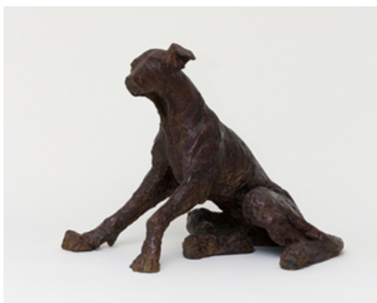
VALEM - Galerie Bénédicte Giniaux LUXEMBOURG ART FAIR du 6 au 9 dec 2018